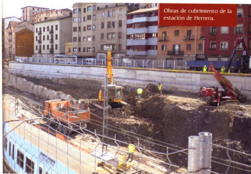
Obras de cubrimiento de la estación de Herrera.

dad a la que se ubica por condicionantes de trazado y atendiendo a las características del terreno, se ha adoptado una tipología de estación en caverna con andenes laterales. Cada andén dispone de dos escaleras que dan acceso a sendas mezzaninas donde se alojan los vestíbulos de la terminal. A los andenes también se podrá acceder