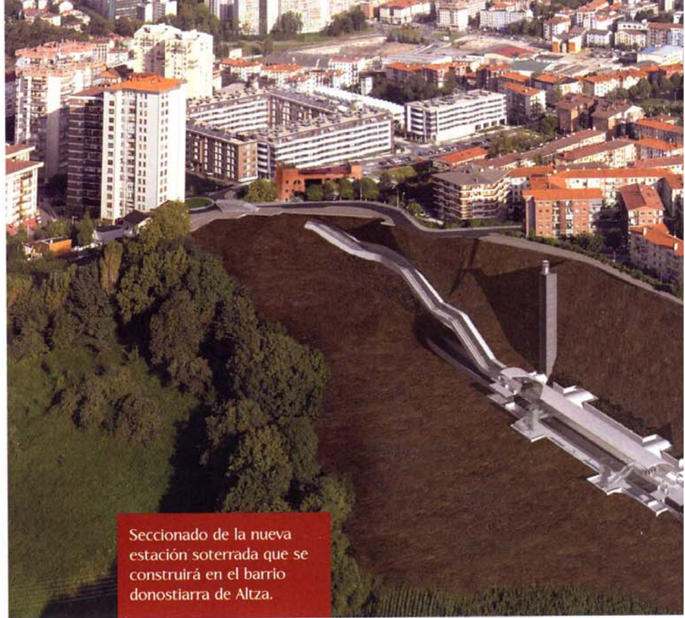
Seccionado de la nueva estación soterrada que se construirá en el barrio donostiarra de Altza.

El desdoblamiento del tramo Fandería-Oyarzun, en obra, o el ramal Irún-Fuenterrabía, en estudio, y que contempla paradas en el aeropuerto y en el centro de esta localidad, completan este ambicioso proyecto.